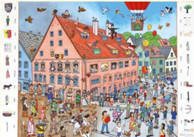
Im Mittelpunkt der neuen Wimmelbuchseite ist die Kramerzunft zu sehen. Figuren aus dem Jahr 1525 sind ebenso zu finden, wie Menschen aus unserer heutigen Zeit.

Zu Gast im Rathaus waren auch Schüler der Klasse 3d der Elsbethenschule, die die neue Wimmelbuchseite druckfrisch von