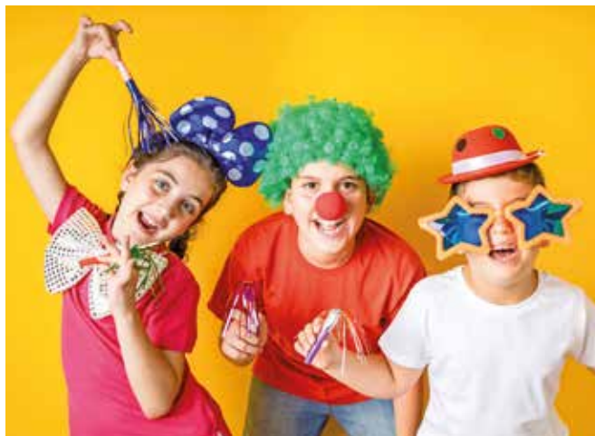
Auch in Memmingen feiern viele Kinder und Jugendliche gerne Fasching und besuchen die zahlreichen Bälle in der Region.

Bier, Wein und Sekt sind ab 16 Jahren erlaubt. Schnaps und branntweinhaltige Getränke wie Cocktails, Geißen- oder Schneemaß dürfen dagegen nur Volljährige trinken. Für Energydrinks gibt es noch keine gesetzliche Altersgrenze. Werden diese aber mit Schnaps gemischt, ist eine Abga-