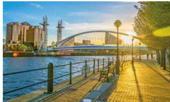
Salford Quays mit der Lowry Fußgängerbrücke und dem markanten Gebäude The Lowry im Hintergrund. Das ehemalige Hafengebiet hat sich zu einem modernen Kultur- und Medienzentrums entwickelt.