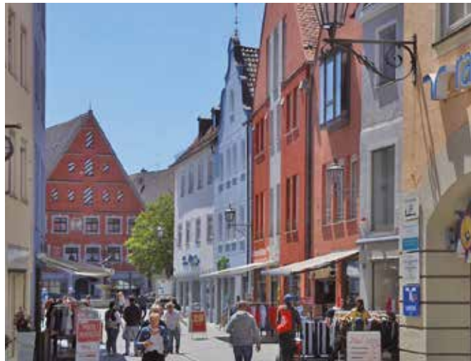
Am 7. März gibt's zum Auftakt des Gedenkjahres und der Feierlichkeiten die Möglichkeit, in Memmingen auch spät am Abend einzukaufen.

Um 17 Uhr beginnt das Event mit der feierlichen Eröffnung des Weinmarktes. Begleitet wird das Festprogramm von einer eindrucksvollen Video-, Licht- und Soundinstallation an der Kramerzunft, die unter dem Titel „Zeitreise 1525“ einen besonderen Einblick in die Geschichte der Stadt bietet – eine visuelle Zeitreise zurück in die damaligen Geschehnisse. Die Zeitreise 1525 führt auf einen Erlebnisrundgang u. a. entlang des Stadtbaches zur Martinskirche und über den Schweizerberg zurück zum Weinmarkt, von wo aus man unmittelbar seinen Erlebniseinkauf in der Stadt beginnen kann. Das Projektbüro „Stadt der Freiheitsrechte“ zeich-