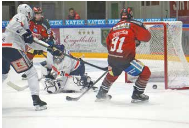
Die Play-Offs versprechen heiße und enge Duelle – wie hier im Haupttrundenspiel gegen Bietigheim.

Was bedeutet, dass ein eventuelles fünftes und entscheidendes Spiel am Hühnerberg stattfinden würde. Sicherlich vorteilhaft, weil die Indians aus Hannover ähnlich phantastische Fans wie unsere GEFRO-Indians im