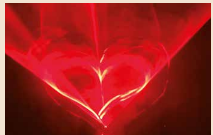
Multimediale Live-Performance im Kirchenschiff der Stadtpfarrkirche St. Martin von Lichtkünstlern des Ateliers mbeam. Foto: In mein Herz © mbeam

Das umfangreiche Rahmenprogramm zum Gedenkjahr ist eine besondere Gelegenheit, die Geschichte der Freiheitskämpfer von damals nachzuvollziehen und den Freiheitsgedanken in die Gegenwart zu holen. Weitere Highlights im März von