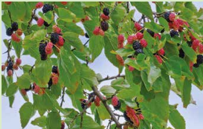
Der Maulbeerbaum ist nicht nur ein wahrer Hitzekünstler, er trägt auch schmackhafte Früchte.

Seit etwa zehn Jahren wird zu den Klimabäumen geforscht. Diese neuen Bäume sollen die alten, heimischen Baumarten allerdings nicht ersetzen, sondern ergänzen. Denn Vielfalt beugt bekanntlich großflächigem Schädlingsbefall vor. Heimische Profiteure der warmen Sommer sind der Feldahorn oder die Elsbeere.