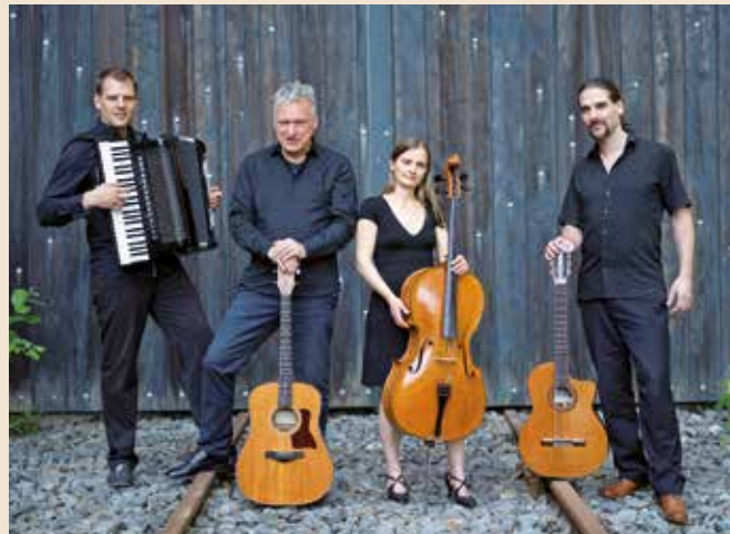
„Die Grenzgänger“ laden ein zum Kneipenkonzert am 7. März im Weber am Bach.