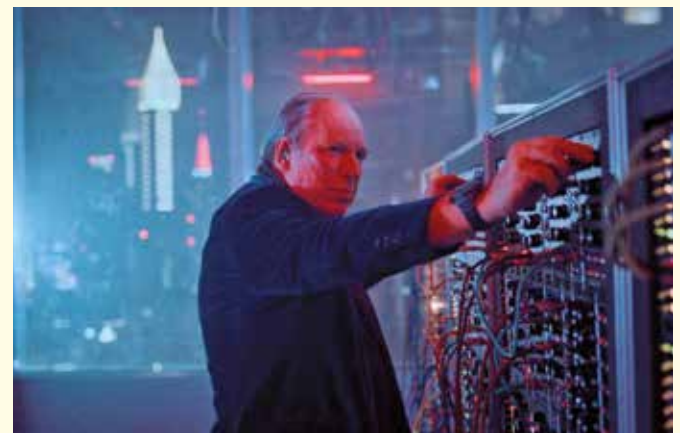
Hans Zimmer Szene.

Mit Gesprächen mit Billie Eilish, Sir Christopher Nolan, Denis Vil-