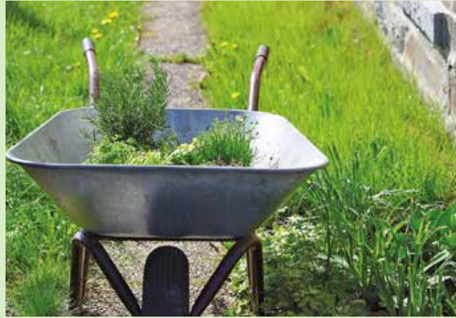
Das Frühjahr ist optimal, um ein Beet für die Lieblingskräuter im Garten zu planen und anzulegen.

In einem Hochbeet lassen sich Kräuter ebenfalls gut anbauen, auch auf dem Balkon. Weil das Wasser abfließen kann, entsteht keine Staunässe. Mehrjährige Kräuter werden am besten auf die eine Seite und einjährige auf