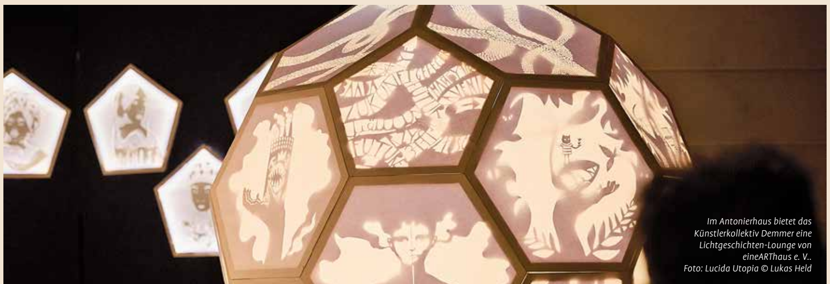
Im Antonierhaus bietet das Künstlerkollektiv Demmer eine Lichtgeschichten-Lounge von eineARThaus e. V..

Kunstprojekten reichen über besondere Ausstellungen bis hin zu Theater und Vorträgen. Den Programmkalender finden Sie unter www.stadt-der-freiheitsrechte.de