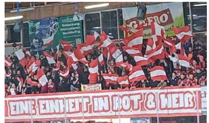
Die Memminger Fans als „extra“-Rückhalt für das Team.

Aber die Memminger – Team und vor allem auch die Fans – sind heiß auf die Play-Offs und wollen möglichst weit kom-