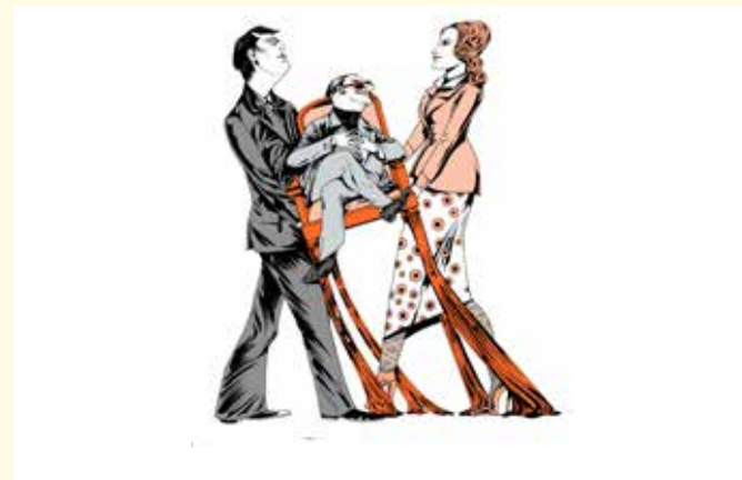
Grafik: Michael Hahn, Pink Gorilla Design

Memmingen (dl/rad). Zwei Premieren stehen im März im Landestheater Schwaben im Fokus. Zum einen das Schauspiel „Animal Farm“ am 21. März und eine Woche später, am 29. März, die Komödie „Das Abschiedsdinner“.