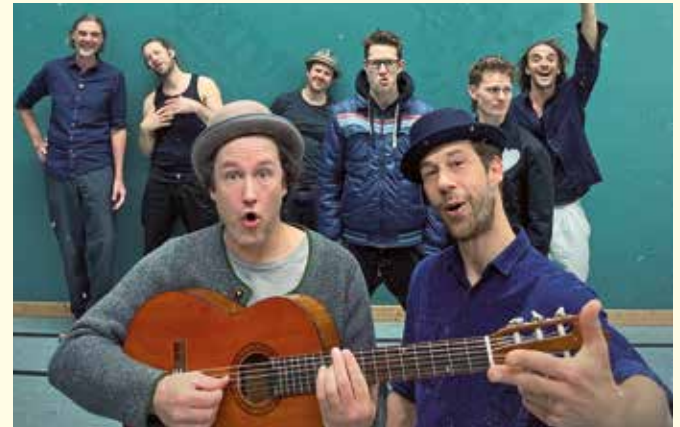
Jamaram meets Jahcoustix kommt am 22. März ins Kaminwerk.

Memmingen (dl). Die Reggae Combo Jamaram heizt am Samstag, 22. März, dem Publikum im Kaminwerk ordentlich ein. Die Band steht für Frieden, Weltoffenheit und Respekt, gegen Krieg, Intoleranz und Abschottung. Ohne Grenzen und Mauern – bunte Vielfalt und Lebensfreude, im echten Leben wie in der Musik.