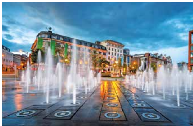
Piccadilly Gardens ist ein zentraler Platz in Manchester, der für seine Wasserspiele und Grünflächen bekannt ist. Er liegt im Stadtzentrum und ist ein wichtiger Verkehrsknotenpunkt mit Bus- und Straßenbahnhaltestellen.

Manchester ist weltberühmt für seine Fußballtradition. Ein Besuch im Old Trafford, der Heimat von