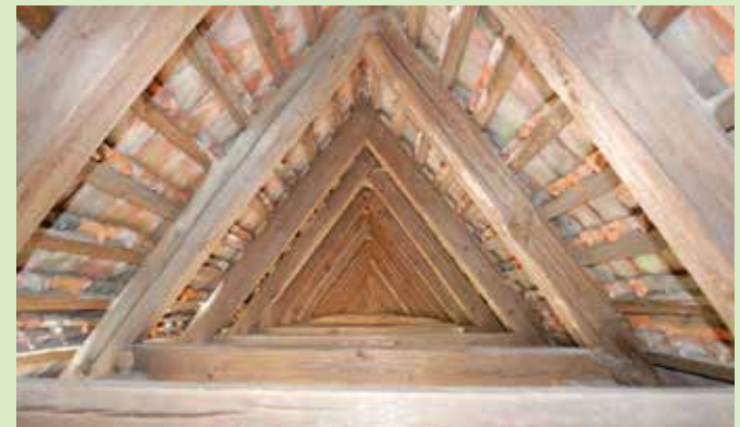
Wenn die äußere Gestalt eines Gebäudes nicht verändert wird, muss der Ausbau eines Dachgeschosses nicht mehr genehmigt werden.

(dl). Seit dem 1. Januar 2025 gelten in Bayern neue Regelungen für den Ausbau von Dachgeschossen, einschließlich Dachgauben. Grundlage ist die Änderung von Art. 57 Abs. 1 Nr. 18 der Bayerischen Bauordnung. Ziel ist es, Bauvorhaben zu beschleunigen und bürokratische Hürden abzubauen.