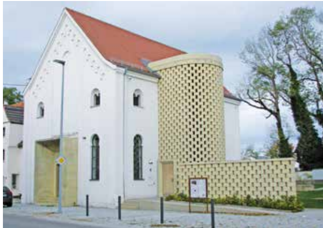
In der ehemaligen Synagoge in Fellheim sollen noch mehr Schulklassen im Rahmen eines Pilotprojektes Geschichte vor Ort erfahren.

Fellheim (mk). Die ehemalige Synagoge in Fellheim ist bislang hauptsächlich von Gymnasien aus der Region besucht worden. In einem Pilotprojekt sollen nun zehn Mittelschulen den „Lernort ehemalige Synagoge Fellheim“ besuchen, um dort mehr über die jüdische Vergangenheit in dem unterallgäuer Dorf zu erfahren.