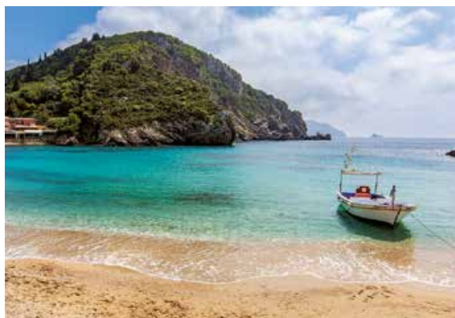
Genießen Sie den atemberaubenden Blick auf das Meer von einem der vielen Strände der Insel.

Korfu ist bekannt für seine wunderschönen Strände und das kristallklare Wasser. Der Strand von Paleokastritsa ist ein beliebter Ort zum Sonnenbaden und Schwimmen, während der Strand von Glyfada