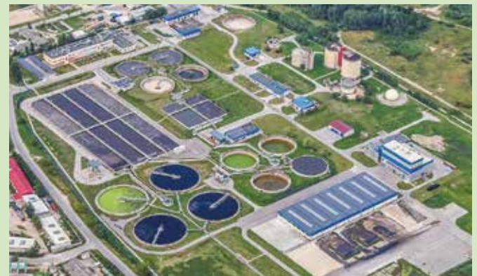
Abwasser wird in die Kläranlage geleitet – neue Häuser oder Grundstücke zahlen für den erstmaligen Anschluss eine Gebühr.

Die Herstellungsbeiträge waren zuletzt im Jahr 2001 festgelegt worden. Nun soll der Beitrag von bisher 2,10 Euro auf 2,85 Euro pro Quadratmeter Grundfläche und von aktuell 3,60 Euro auf 7,80 Euro pro Quadratmeter Geschossfläche erhöht werden. Die Beiträge werden nur einmalig für die Errichtung der notwendigen Infrastruktur erhoben.