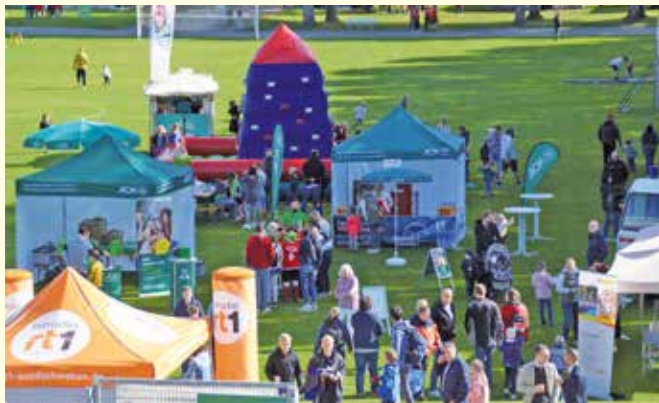
Am 22. September findet der AOK-Familientag statt, wie im letzten Jahr wieder mit allerlei Aktionen im Memminger Stadion an der Bodenseestraße.

Memmingen (dl). Der „AOK Familientag ohne Grenzen“ findet heuer am Sonntag, 22. September, von 10 bis 16 Uhr im Memminger Stadion statt. Mit vielen Spiel- und Mitmachangeboten für alle Altersklassen verwandelt sich das Stadiongelände wieder in eine aufregende Abenteuerwelt – für Menschen mit und ohne Behinderung.