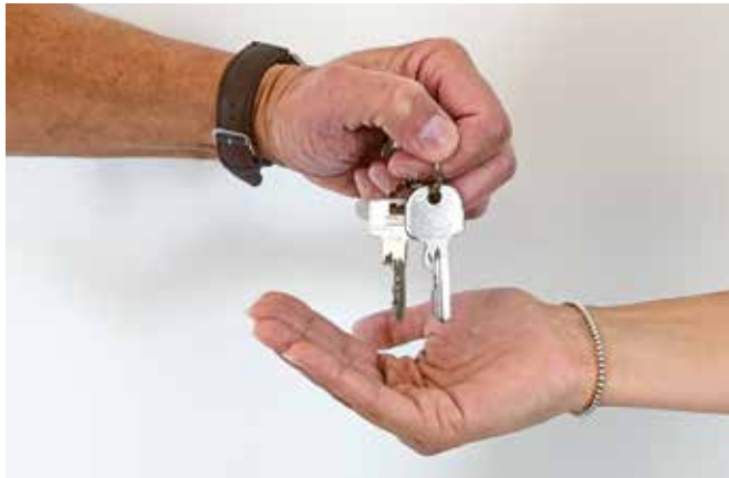
Es braucht meist viel Zeit und Geduld, bis die Schlüssel vertrauensvoll in die Hände der nächsten Generation gelegt werden.

(sg). Familienunternehmen sind ein wichtiger Motor und einer der Erfolgsgaranten der deutschen Wirtschaft – für die Gegenwart und für die Zukunft. Doch damit es weitergeht, braucht es einen Nachfolger. Dieser kann in den Reihen der Familie oder extern gefunden werden. In jedem Fall bedarf der Generationenwechsel Zeit, Geduld, guter Gespräche und Berater, Weitblick und viel Fingerspitzengefühl.