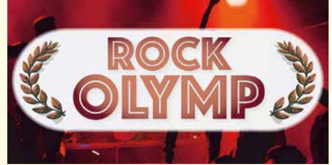
Grafik: Frank Reinelt

Damona wurde von der „New Music Hotlist“ in der Sparte „Beste Newcomerin 2024“ nominiert. Sie singt, sie springt, sie spricht zum Publikum und das alles so, als hätte sie noch nie etwas anderes getan. Dabei sind es ihre ersten Live-Shows mit eigener Band. Dennoch hat sie diesen Sommer bereits vor Tausenden auf Festivalbühnen wie dem PULS Festival, Modu-