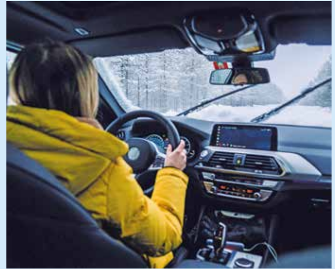
Ein Allradantrieb lohnt sich besonders in schneereichen Regionen

(sg). Ob ein Auto mit dem Vorderradantrieb gezogen oder mit dem Heckantrieb geschoben wird, hat Effekte auf die Fahreigenschaften. Ebenso ein Allradantrieb. In den kalten Wintermonaten sind diese Einflüsse besonders stark. Welcher Antrieb jedoch am Ende der Beste ist, kommt darauf an, wo und wie das Fahrzeug eingesetzt wird. Wir haben Vor- und Nachteile der jeweiligen Antriebsarten zusammengefasst.