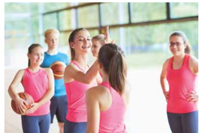
Sportunterricht fördert die körperliche und geistige Entwicklung der Schülerinnen und Schüler.

Der Fitness-Check besteht aus einem Eingangs- und einem Abschlusstest, die in einem Abstand von sechs bis zwölf Monaten durchgeführt werden. Beide Tests messen fünf motorische Grundfähigkeiten: Ausdauer, Ko-