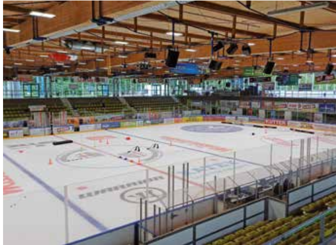
Die Eisfläche ist schon bereit, jetzt kann's dann auch für die GEFRO-Indians wieder losgehen.

Memmingen (dl/rad). Es geht wieder los – die bei den Fans heißbegehrte Eiszeit mit den GEFRO-Indians beginnt wieder. Mit dem ersten September-Wochenende starten die Cracks des ECDC Memmingen mit den Testspielen in die neue Saison.