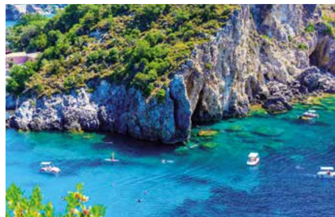
Ein Bootsausflug entlang der Küste offenbart das kristallklare Meer und die versteckten Buchten Korfus.