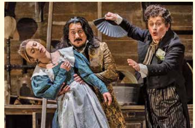
Das Royal Ballet bringt die „Hochzeit des Figaro“ in die Kinos.

Der Graf Almaviva lebt mit seiner Gräfin in ihrem Schloss bei Sevilla. Der Graf hat ein Auge auf Susanna, die Kammerzofe seiner Frau, geworfen, doch Susanne ist kurz davor, Figaro, den Kammerdiener des Grafen, zu heiraten. Zum Entsetzen Figaros plant der Graf, Susanna am Abend der Hochzeit zu verführen und er beschließt, dass er diesen Versuch des Grafen verhindern muss ... Dabei kommt es zu einer Reihe von Verwechslungen, Missverständnissen und vereitelten Plänen, in die sämtliche Mitglieder