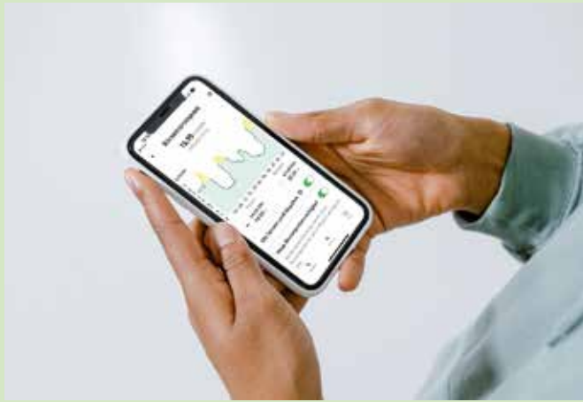
Mit der enerixControl-App können Kunden ihr eigener Energiemanager sein.

Für Nutzer sind Kosten und eigener Verbrauch z. B. in einer