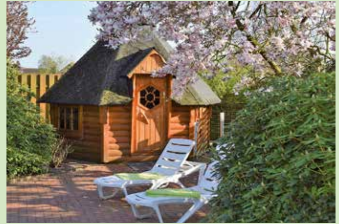
Für eine Gartensauna gibt es viele unterschiedliche Varianten, je nach Geschmack und Budget.

Wie groß die Sauna im Garten sein soll, hängt natürlich vom Platz und den Nutzungspräferenzen ab. Eine kleine Fasssauna mit zwei bis vier Plätzen reicht aus, wenn man vor allem alleine oder mit dem Partner sauniert.