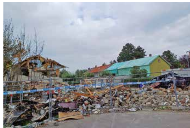
Die Aufräumarbeiten dauern an, ebenso wie die Ermittlung der Ursache.

Den Schock, die Eindrücke, Geräusche und Emotionen der Explosion mit ohrenbetäubendem Knall werden die Menschen ver-