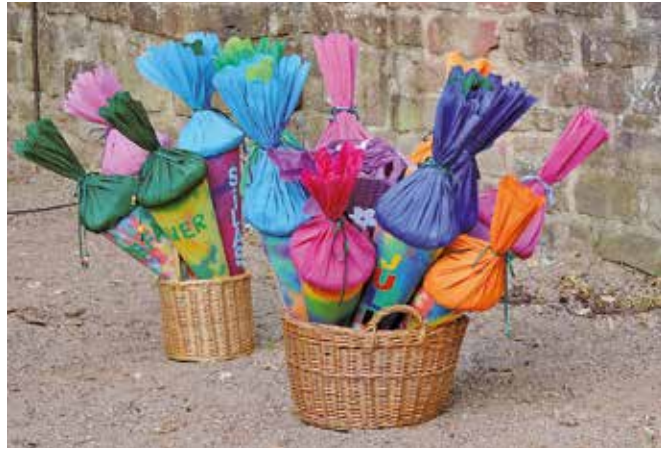
Die Schultüte darf bei der Einschulung nicht fehlen.

Rituale und Traditionen zum Schulanfang geben Kindern ein