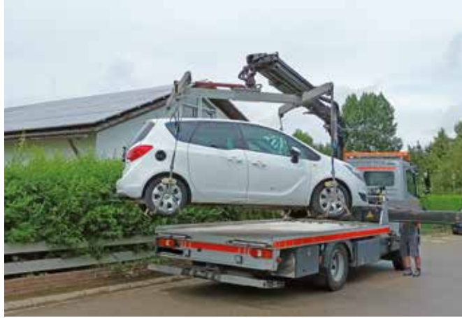
In Memmingerberg werden Wildparker weiterhin konsequent abgeschleppt.

Memmingerberg (sg). Seit gut einem Jahr geht die Gemeinde Memmingerberg mit rigorosem Abschleppen konsequent gegen Wildparker vor. Dennoch entspannt sich die Lage in Memmingerberg sowie in den angrenzenden Straßen in Memmingen nur unzureichend. Genügend offizielle Parkplätze wären vorhanden, die auch die weiter ansteigenden Passagierzahlen am Airport auffangen könnten.