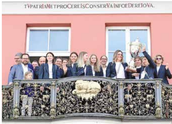
Die „standesgemäße“ Ehrung auf dem Balkon der Memminger Großzunft für die Eishockey-Frauen des ECDC Memmingen.