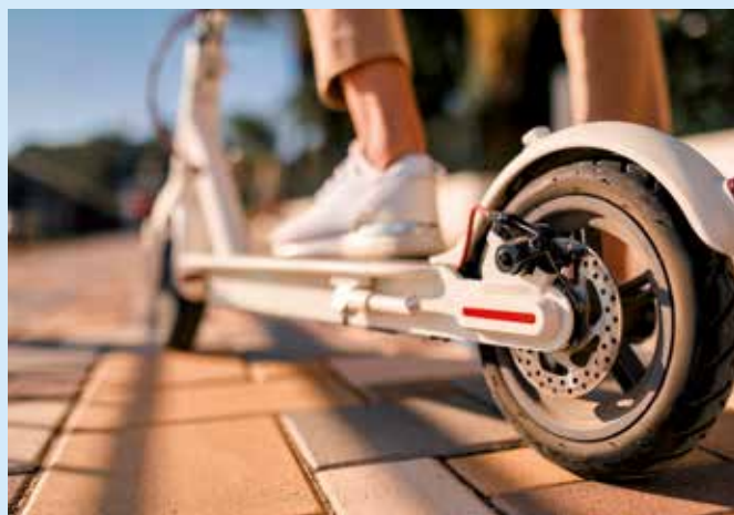
Die Verkehrsregeln für E-Roller werden den Regeln für Fahrräder angeglichen.

E-Bikes sind mit einem Elektromotor zu vergleichen. Sie können allein durch den elektrischen Motor (ohne Tretunterstützung) eine Geschwindigkeit von bis zu 25 km/h erreichen. Versicherungskennzeichen, Betriebserlaubnis und mindestens eine Mofa-Prüfbescheinigung sind zum Fahren notwendig. Zudem muss ein geeigneter Helm getragen werden. E-Bikes dürfen nur auf Radwe-