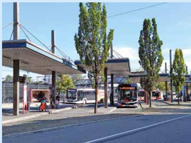
Die Stadt Memmingen sowie die Landkreise Unterallgäu und Günzburg wollen den ÖPNV attraktiver machen – mit ID-basiertem Ticketing und der Aufwertung der Buslinie Memmingen-Krumbach-Augsburg.

Unterallgäu (dl). Die Mittel für das Modellprojekt MUT 2.0 wurden aufgrund der angespannten Haushaltslage vom Bund gestrichen. Dennoch wollen die Landkreise Unterallgäu, Günzburg und die Stadt Memmingen den Öffentlichen Personennahverkehr (ÖPNV) attraktiver machen und nun zwei Teilmaßnahmen aus dem Modellprojekt realisieren.