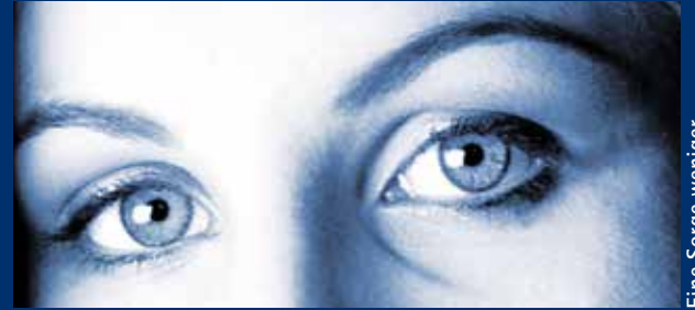
Eine Sorge weniger ...

Tel. 08331 94500 Schumannstraße 8 87700 Memmingen