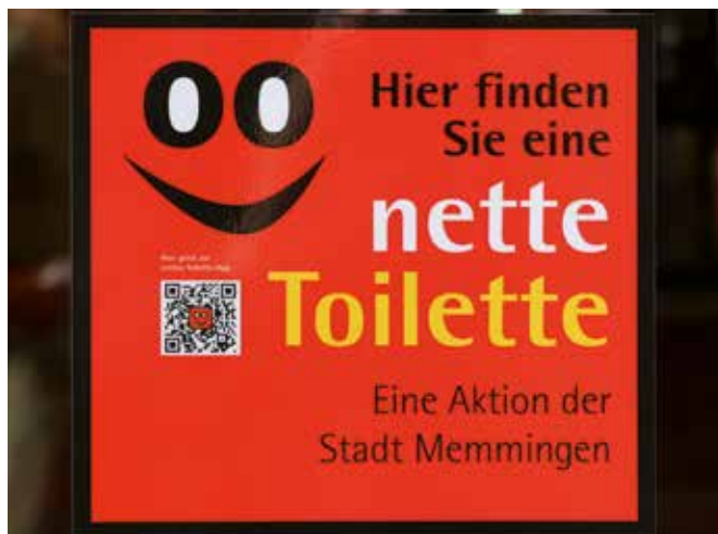
Der Aufkleber mit dem „nette Toilette“-Logo weist Gästen den Weg.

Die Stadt Memmingen verzeichnet als Einkaufs- und Tourismusstandort in der Region Allgäu immer größer werdende Besucherzahlen. Doch die Versorgungssituation im Hinblick auf öffentliche Toiletten war bisher wenig zufriedenstellend. Helfen soll nun das Projekt „nette Toilette“, das es bereits in anderen Städten gibt. Eine „nette Toilette“ darf kostenfrei und ganz ohne Kaufzwang genutzt werden. Ein im Eingangsbereich gut sichtbar angebrachter Aufkleber (siehe Foto) zeigt Gästen die Nutzungsmöglichkeit an. Die Stadt Memmingen hat sieben Gastronomen für eine Kooperation gewinnen können: