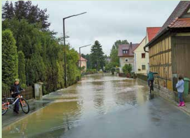
Bei Starkregen steht das Wasser oft auf der Straße und kann auch in den Keller eindringen.

(sg). Starkregenereignisse haben in den letzten Jahren deutlich zugenommen, das haben wir hier in der Region beim Hochwasser Anfang Juni erlebt. Selbst mitten in der Stadt laufen dann die Keller voll. Wir haben zusammengefasst, wie Sie sich schützen können und wie Sie bei Wasser im Keller richtig reagieren.