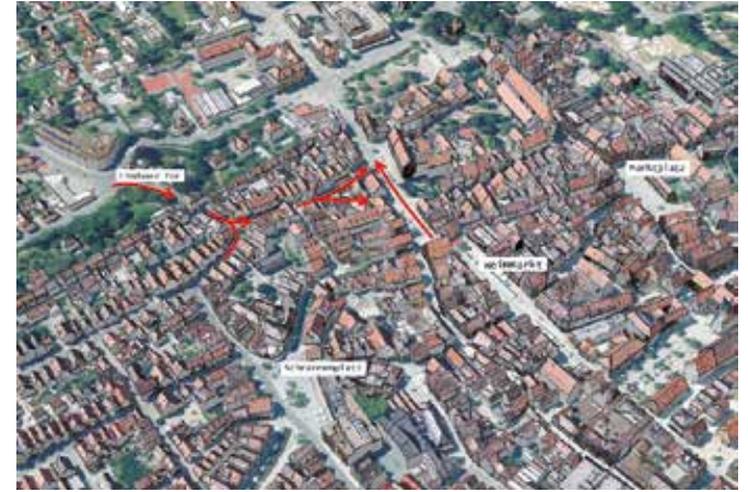
Grafische Darstellung der neuen Verkehrsführung in der Altstadt. Grafik: Digitaler Zwilling Stadt Memmingen

Die Fahrtrichtung im Klösterle wurde bereits gedreht. Erste Ergebnisse haben gezeigt, dass sich die Zahl der durchfahrenden Autos von circa 2.500 werktäglich auf rund 450 reduziert hat. Laut Polizei kam es im Zuge der Drehung zu keinen größeren Problemen.