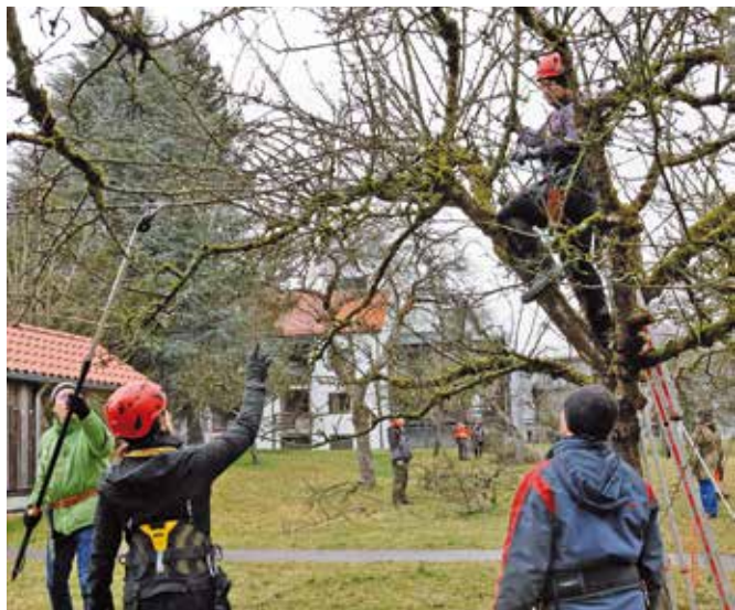
Zur Pflege der Streuobstbäume wird ein Expertenteam ausgebildet, das den Gemeinden und der Bevölkerung bald mit Rat und Tat zur Seite stehen soll.