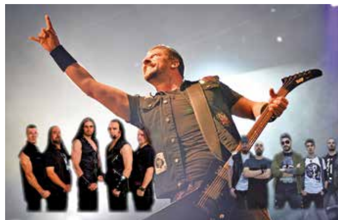
Am 27. April bringen drei Bands – SAD, Manomore und Danger Line – eine große Portion Heavy Metal auf die Bühne im Kaminwerk.

Am Samstag, 27. April, hat das Memminger Kulturzentrum Kaminwerk wieder die besten Tributebands Europas eingeladen. Diesmal spielen ab 20 Uhr SAD