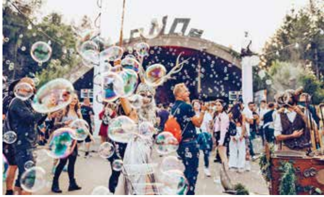
Das Ikarus Festival verspricht heuer ein grenzenloses musikalisches Erlebnis mit vielen Highlights.

Unter dem Motto „Gemeinsam grenzenlos“ setzt das Ikarus Festival, das größte seiner Art in Süddeutschland, dabei heuer nochmal neue Maßstäbe für Größe, Vielfalt und Qualität – mit den besten internationalen Künstlern der elektronischen Szene auf acht außergewöhnlichen Bühnen und rund 130.000 erwarteten Gästen.