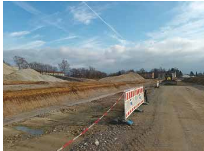
Der ausgehobene Kanal für die drei mal drei Meter großen Rohre auf einer Länge von 360 Metern nimmt sichtbar Form an.

Die Verlegung des Mischwassersammlers – in einen 26.000 Kubikmeter großen und 360 Meter langen Kanal – ist notwendig, um das Baufeld daneben für das Neue Klinikum frei zu machen. Durch eingebaute Wärmetauscher kann die Energie des Mischwassersammlers schließlich vom Klinikum genutzt werden, was deutschlandweit einmalig ist. Sind die Kanalarbeiten abgeschlossen, soll heuer im Herbst der offizielle Spatenstich folgen und im Frühjahr 2025 mit dem Bau des Rohbaus begonnen werden. Die Eröffnung des rund 500