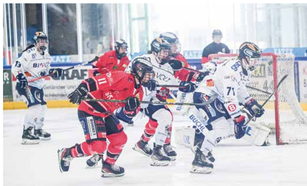
Die Duelle der beiden besten deutschen Fraueneishockey-Teams waren immer „enge“ Kisten – so wie beim 4:3-Heimsieg der Indians-Frauen, aus dem unsere Szene stammt.