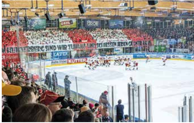
Die Fans der GEFRO-Indians waren eines der Highlights der Runde. Tolle Stimmung, tolle Choreographien und auch reisefreudig.

Memmingen (rad). Es war eine weitgehend erfolgreiche und für die Fans spannende Runde, die Eishockey-Oberligist ECDC Memmingen heuer gespielt hat. Bisweilen waren starke Leistungsschwankungen unübersehbar, dennoch war es die zweitbeste Saison in der Vereinsgeschichte der GEFRO-Indians.