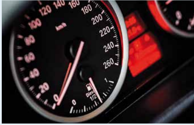
Ab Sommer 2024 soll „ISA“ in Neuwagen das Tempo kontrollieren.

(sg). Moderne Autos sind schon jetzt fahrende Computer mit vielen Sensoren und Steuergeräten. Ab Sommer 2024 soll auf Grundlage einer EU-Verordnung noch „ISA“, kurz für „Intelligent Speed Assistance“, den Fahrer bei der Einhaltung von Tempolimits unterstützen und damit für mehr Sicherheit im Straßenverkehr sorgen.