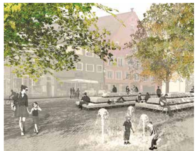
Die Umgestaltung des Weinmarkts beginnt in diesem Frühjahr.

Die einzelnen Baumgruben werden direkt nach dem Einbau eines Pflanzsubstrats provisorisch verschlossen und teilweise gepflastert, so dass diese Flächen unmittelbar wieder genutzt werden können. Die Bäume selbst werden im Herbst gepflanzt. Die einzelnen Bauabschnitte im Zuge der Umgestal-