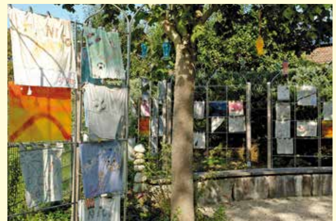
Von den Familien gestaltete Fahnen werden nach dem Tod des Kindes in den Garten gehangen, an einen Ort zum Gedenken und zur Erinnerung.

Bad Grönenbach (dl). Das Kinderhospiz St. Nikolaus ist ein Haus voller Leben und Lachen und bietet Familien mit lebensverkürzend erkrankten Kindern und Jugendlichen eine Auszeit von ihrem belastenden Alltag. Das Team des Hospizes begleitet die betroffenen Familien bereits ab der Diagnosestellung der unheilbaren Krankheit, oft über Jahre hinweg – und auch in der Trauer.