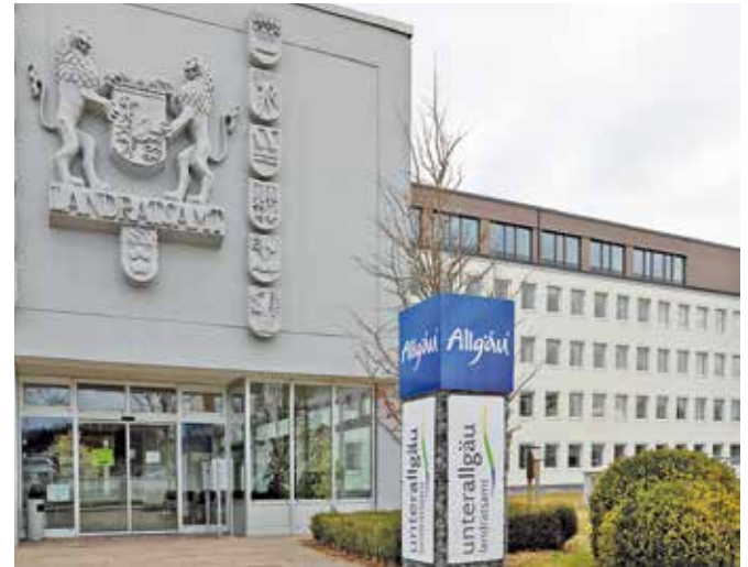
Mit einem „Kraftakt“ wurde der Kreishaushalt 2024 beschlossen.