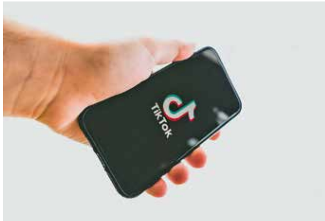
Fast jeder Jugendliche benutzt Tik Tok, ein Leben ohne soziale Medien ist kaum noch vorstellbar – doch es gibt auch Gefahren und Risiken.

(nvr). „Digitale Demokratie“ – was ist darunter zu verstehen? Soziale Medien wie Instagram oder Tik Tok & Co werden vor allem von der jungen Generation bevorzugt. Aber welchen Einfluss haben die neuen Medien auf die Überzeugungen und Werte der Nutzer?