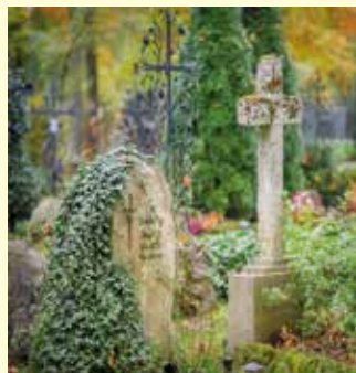
Zur Vorsorge für die Zeit nach dem Tod gehört unter anderem das Aussuchen einer Grabstelle.

(sg). Auch wenn wir es gerne verdrängen: Wir alle werden irgendwann sterben – und für den Todesfall kann man vorsorgen. Es gibt gute Gründe, diesen Schritt auch in jungen Jahren schon anzugehen und letztlich die Angehörigen zu entlasten. Wer dabei nur die eigene Beerdigung berücksichtigt, denkt nicht weit genug – zur Vorsorge gehört noch einiges mehr.