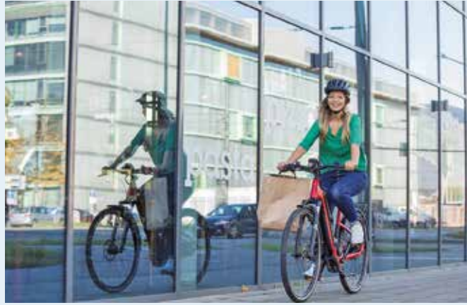
Clever mobil sind Arbeitnehmer, wenn das Wunschrad das günstig finanzierte Dienstrad wird.

Ottobeuren (sg). Immer mehr Firmen bieten „Mitarbeiter-Benefits“ an, sehr beliebt ist ein Dienstrad. Mit Diamant & Partner gibt es dazu einen kompetenten Ansprechpartner vor Ort. Dabei hat es nicht nur finanzielle Vorteile, das Wunschrad über den Arbeitgeber zu leasen – privat und beruflich auf dem Zweirad unterwegs zu sein fördert vor allem auch die Gesundheit.