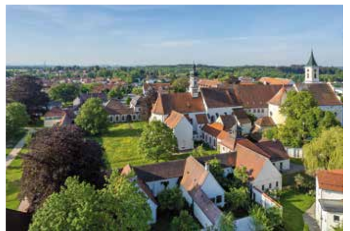
Die Kartause Buxheim öffnet wieder ihre Türen und lädt zu zahlreichen kulturellen Highlights ein.

Freunde von Illustration und Malerei kommen bei der Ausstellung „In meinem Element“ ab