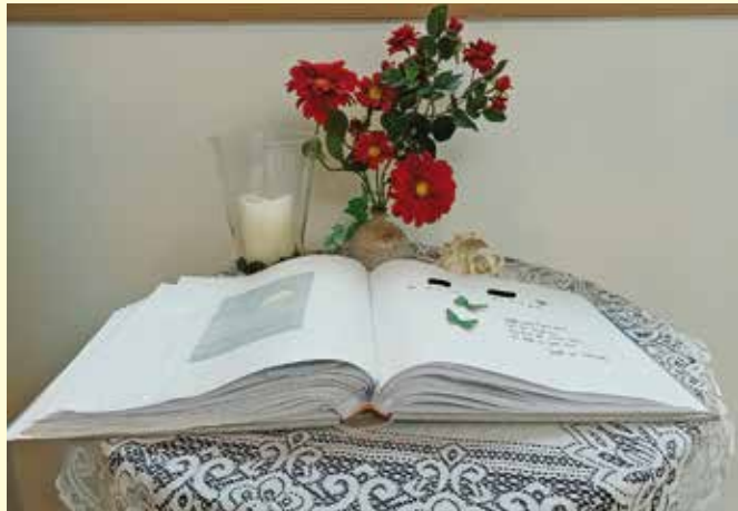
Die Seiten im Gedenkbuch sind individuell gestaltet – mit Name, Lebensdaten, einem Spruch oder einem Bild.

Irgendwann kommt der Zeitpunkt, wo sie ihre „letzte Reise“