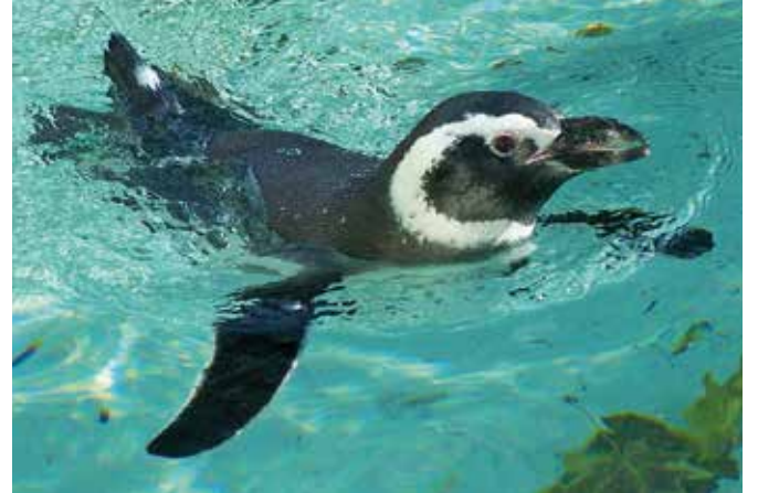
Am 28. April ist Weltpinguintag. Im Zoo Augsburg lebt z. B. der Magellanpinguin.

Weiter geht es mit einer Abendführung am 26. April. Bei dem abendlichen Rundgang in Begleitung eines Zoomitarbeiters erfahren die Teilnehmer viel Wis-