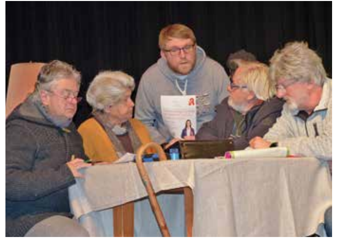
Im Stück „Unter den Linden“ finden im Seniorenheim nächtliche Versammlungen statt.

Neues Stück der Buxheimer Theater-Gaukler