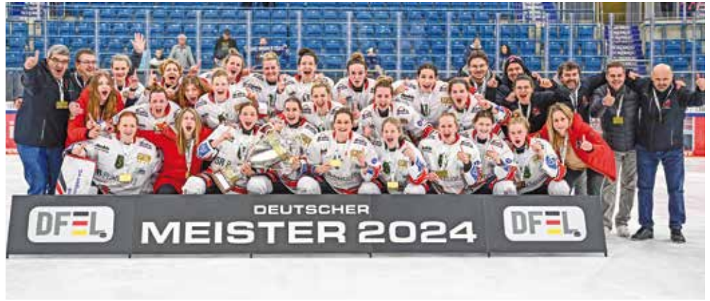
Die Eishockey-Frauen des ECDC Memmingen haben ihren Titel aus dem Vorjahr erfolgreich verteidigt – im Schnelldurchgang mit jeweils drei Siegen gegen Mannheim und Ingolstadt in den Play-Offs.

EWHL-Finalturnier im schweizerischen Zug qualifiziert. Obendrein hat das Team erfolgreich beim internationalen Zürich Cup teilgenommen – alles sportliche Hochkaräter.