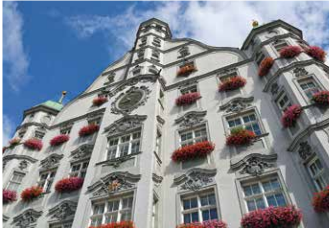
Der Memminger Stadtrat hat den Haushalt für 2024 verabschiedet und eine Erhöhung der Gewerbe- und Grundsteuer beschlossen.

Memmingen (dl). Der diesjährige Haushaltsplan der Stadt Memmingen wurde mit einem Gesamtvolumen von rund 240 Millionen Euro verabschiedet. Für einen ausgeglichenen und rechtskonformen Haushalt sollen Kürzungen in der Verwaltung sowie eine Erhöhung der Gewerbe- und Grundsteuer und der Parkgebühren sorgen. Investitionen in Höhe von 30 Millionen Euro sind vor allem in Bauprojekte, Infrastruktur und Bildung geplant.