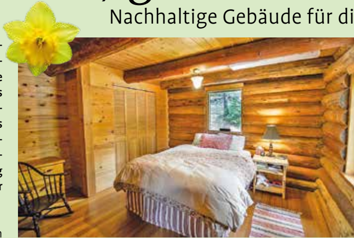
Naturmaterialien wie Holz gehören zu einer nachhaltigen Bauweise und sorgen für ein Wohlfühlklima in den eigenen vier Wänden.

Das Planen von ökologischen Gebäuden berücksichtigt den gesamten Lebenszyklus: von den Produktlinien und Lieferketten über die Verarbeitung bis hin zum Rückbau und zur Entsorgung. Die Nachteile bestehender Bautechniken lassen sich mit einer zirkulären Bauweise, die vermehrt auf nachwachsende Baustoffe oder wiederverwendbarer Bauteile setzt, somit vermeiden.