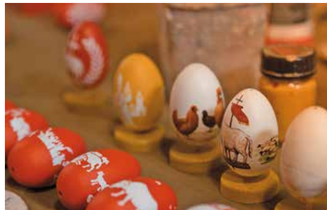
Beim Osterferien-Programm im Bauernhaus-Museum werden unter anderem Ostereier mit Naturmaterialien gefärbt.

Der große Ostermarkt lädt am Montag, 1. April, von 10 bis 16 Uhr zum Bummeln ein: Vom Zuckerbäcker bis zur legendären Ostereiersuche, vom Glasbläser bis zu vielen wunder-