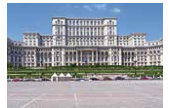
Das beeindruckende Parlamentsgebäude in Bukarest, auch Casa Poporului genannt, ist eines der größten und prächtigsten Parlamentsgebäude der Welt.

Ein weiteres Wahrzeichen der Stadt, das vor allem Musikliebhaber besuchen sollten, ist das Athenaeum. Das George Enescu Philharmonic Orchestra spielt hier das ganze Jahr über. Der Konzertsaal selbst ist bekannt für seine hervorragende Akustik und die prachtvolle Innenausstattung, die den Konzertbesuch zu einem unvergesslichen Erlebnis machen. Das Nachtleben in Bukarest ist ebenso vielfältig wie lebendig. Von traditioneller Live-Musik über elektronische Beats bis hin zu gemütlichen Weinbars bietet die Stadt für jeden Geschmack etwas. Die Einheimischen sind gastfreundlich und die Stadt ist bis in die frühen Morgenstunden voller Leben.