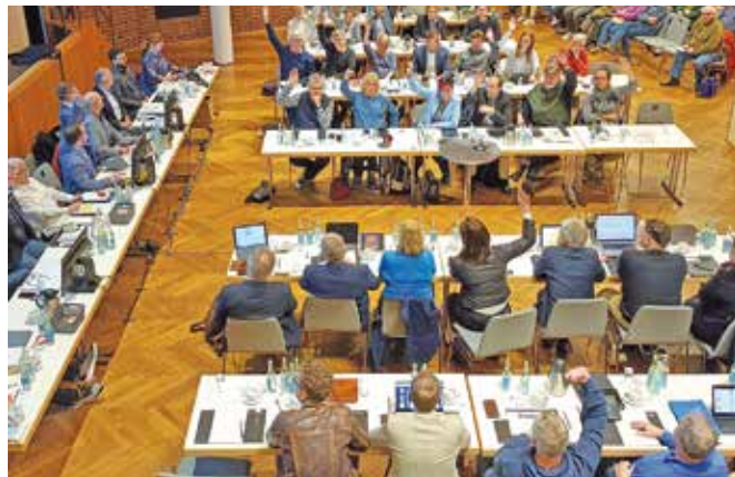
Der Stadtrat hat den Bauantrag für das Minarett an der Moschee in der Schlachthofstraße am 29. Januar mit Stimmengleichheit abgelehnt.

Bei der Errichtung der Moschee sei die Zusage gegeben worden,