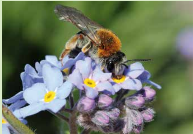
Die rotschopfige Sandbiene ( Andrena haemorrhoa ), eine von 604 heimischen Wildbienen-Arten.

Nie war es wichtiger, eintönige Rasenflächen in summende Paradiese zu verwandeln. Gesucht sind nicht nur insektenfreundlich umgestaltete Privatgärten und Balkone, sondern auch Gärten von Firmen, Schulen, Kitas, Vereinen, Kleingärtnern sowie kommunale Flächen. Warum? Unsere heimischen Wildbienen sind an viele gezüchtete Blumen nicht angepasst. „Um die biologische Vielfalt vor Ort zu