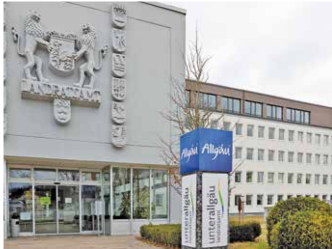
Das Landratsamt in Mindelheim wurde um einen vierten Stock in nachhaltiger Bauweise erweitert.

Für die wachsenden Aufgaben der Behörde bieten nun 48 neue Büros und ein großer Besprechungsraum Platz, die bisherige Verlagerung in Außenstellen kann dadurch teilweise aufgehoben werden. Zu finden sind dort