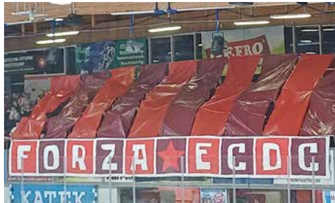
Die GEFRO-Indians bauen auch auf ihre zahlreichen und lautstarken Fans.

Hinter den Top-Teams aus Weiden, dem DEL2-Absteiger Heilbronn und Deggendorf hat sich der ECDC Memmingen den vierten Platz in der Hauptrunde gesichert. Damit steht fest, dass die GEFRO-Indians am 3. März mit