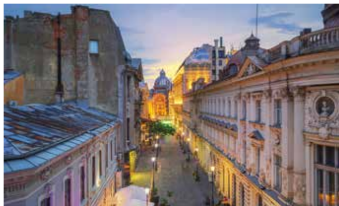
Die bezaubernden Gassen von Bukarest – ein malerischer Spaziergang durch die lebendige Atmosphäre der rumänischen Hauptstadt, wo Geschichte und Kultur aufeinandertreffen.

benfrohen Gebäuden und einer lebhaften Atmosphäre. Hier erwarten den Besucher charmante Cafés, trendige Boutiquen und traditionelle Restaurants. Die kulinarische Vielfalt reicht von deftigen Fleischgerichten bis hin zu köstlichen Süßspeisen, die die Vielfalt der rumänischen Küche widerspiegeln.