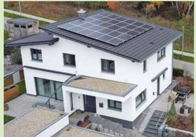
So kann eine fertig installierte PV-Anlage aussehen.

Zuletzt sei die Nachfrage bei den Allgäuer Altbautagen der ezal in Kempten sehr gut gewesen, be-