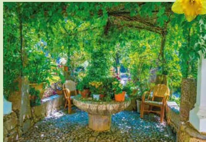
Ein Stück Süden und Urlaub in den Garten holen: So kann ein mediterraner Garten aussehen.

(sg). Urlaub auf Balkonien oder im eigenen Garten, das ist nicht nur für den kleinen Geldbeutel eine schöne Variante sich mit Familie und Freunden zu entspannen. Kreative Handwerker können sich dabei voll ausleben, ebenso wie Garten- und Pflanzenbegeisterte, um eine individuelle Oase mit schöner Atmosphäre zu erschaffen.