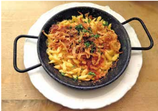
Traditionell wird am Politischen Aschermittwoch zu Kässpatzen eingeladen.

Memmingen (rad/sg/mg/to). Traditionell ist der Aschermittwoch auch der Tag der „politischen Abrechnung“. Da werden die Samthandschuhe ausgezogen und mit „spitzer Zunge“ gegen die anderen Parteien ausgeteilt – zumeist in kabarettistischer oder humoristischer Form, auch bei den lokalen Ortsverbänden. Heuer ging es in Memmingen vor allem um zwei Themen: Das geplante Minarett und die AfD.