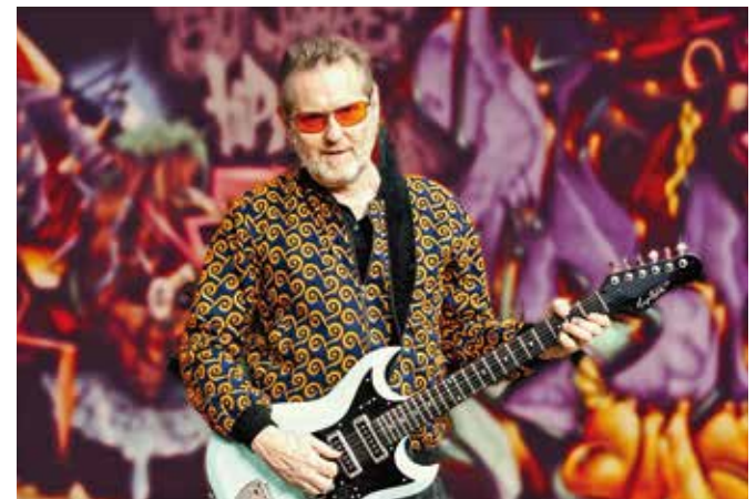
Stoppok kommt mit seinem neuen Album „Teufelsküche“ nach Memmingen.

Stoppok war, ist und bleibt eine Ausnahmeerscheinung auf der Bühne – ein Meister des magischen Moments. Der Hamburger mit der Ruhrpott-Prägung liebt die Energie des authentischen Augenblicks, er mag's live und lebendig, er ist ein hinreißender Entertainer und einmaliger Singersongwriter, wie es ihn in diesem Lande kein zweites Mal gibt. Risiko und Spontaneität zeichnen ihn aus, aus Konzertsälen werden Intensivstationen voller Überraschungen und Improvisation. Wer solch aussagekräftige Texte und Lieder schreibt (von