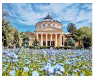
Das majestätische Athenäum von Bukarest ist ein Wahrzeichen der rumänischen Hauptstadt, in dem sich Musik und Kunst begegnen.

Die Altstadt, Lipscani genannt, ist ein lebendiges Viertel mit Kopfsteinpflasterstraßen, far-